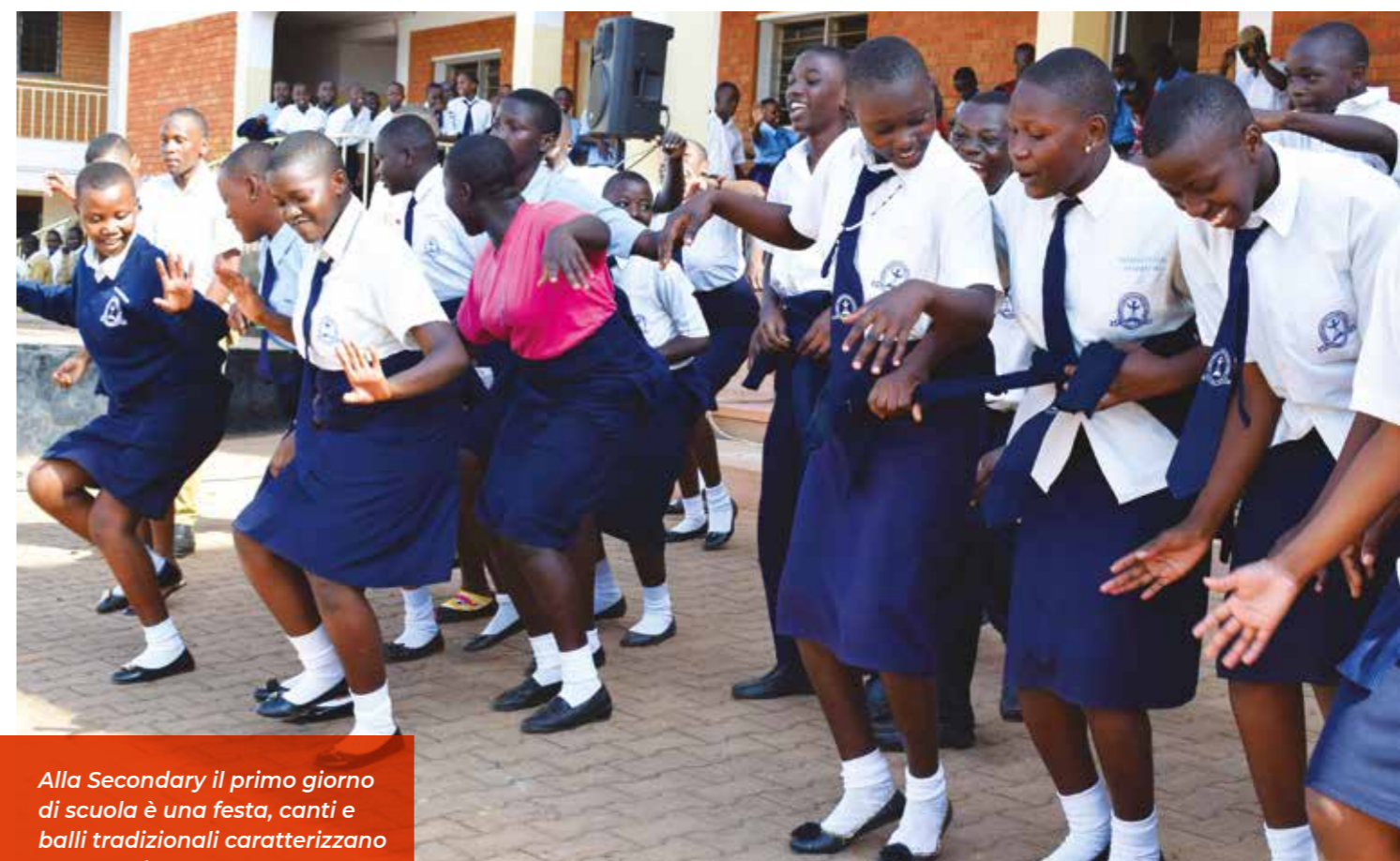
Alla Secondary il primo giorno di scuola è una festa, canti e balli tradizionali caratterizzano tutta la giornata

4 febbraio, ore 8:00: anche alla Secondary i ragazzi sono riuniti in giardino pronti per cominciare, ma loro lo fanno in un modo tutto speciale. La prima